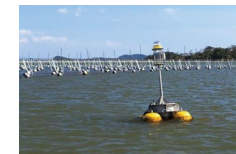
例：海洋観測ブイによる漁場環境モニタリング技術の開発