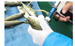
例：ワクチンの開発