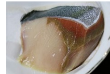
例：冷凍ブリの褐変防止技術の開発