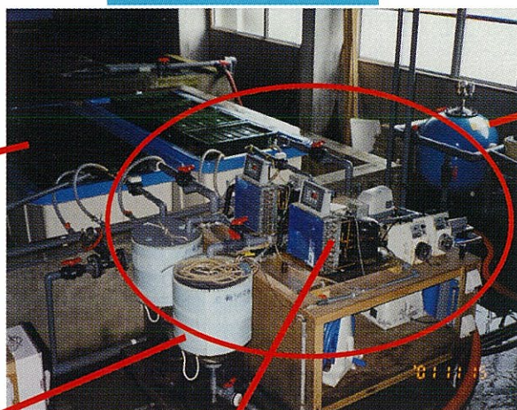
飼育試験施設全景